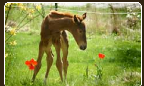
Für mehr Sicherheit in der Pferdehaltung und ein sicheres Abfohlen.