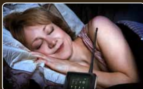
Bequeme Überwachung von zu Hause aus.