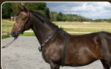
horseAlarm sicher am Pferd angelegt.