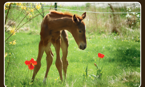
Turvalliselle hevosjalostukselle ja varsomiselle.