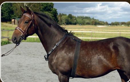
horseAlarm on varmasti ja turvallisesti kiinnitetty hevoseesi.