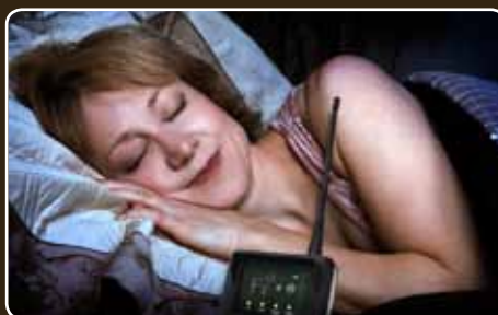
Bekväm och trygg uppsikt från ditt hem.