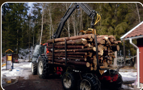
Die Kamera überwacht ausgewählte Bereiche rund um das Fahrzeug.