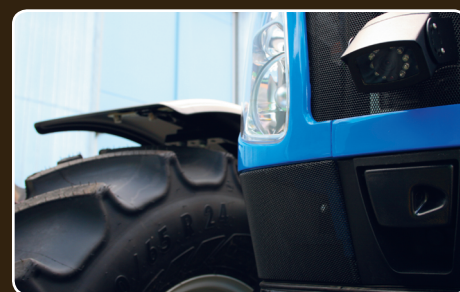
Niezawodna kamera w każdych warunkach pogodowych.