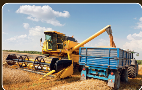
Kamera monitoruje wybrane obszary wokół pojazdu.