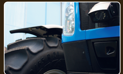
Robust kamera för alla väderförhållanden.