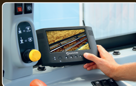
Störningsfri bild på 7" LCD-skärmen.