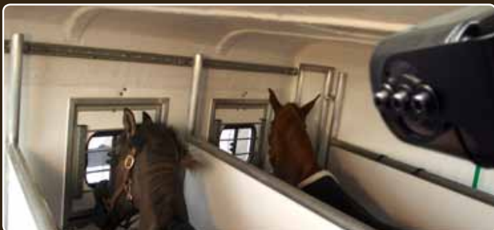
Der trailerCam™ Weitwinkel ermöglicht das Überwachen zweier Pferde im Bild.