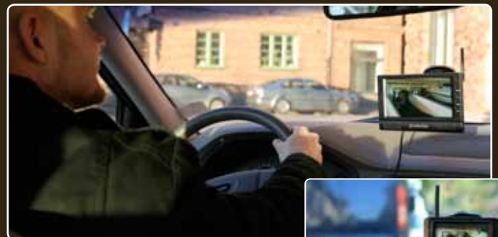
Mit dem 3,6" oder 7" LCD-Bildschirm sehen Sie deutlich und jederzeit, wie es Ihren Pferden im Anhänger geht.