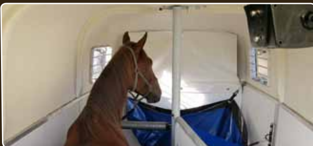
Das Weitwinkelobjektiv der trailerCam™ kann mehrere Pferde in nur einem Bild aufnehmen.