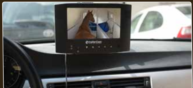
Klares und deutliches Bild auf dem 7"-LCD-Monitor unter allen Bedingungen.